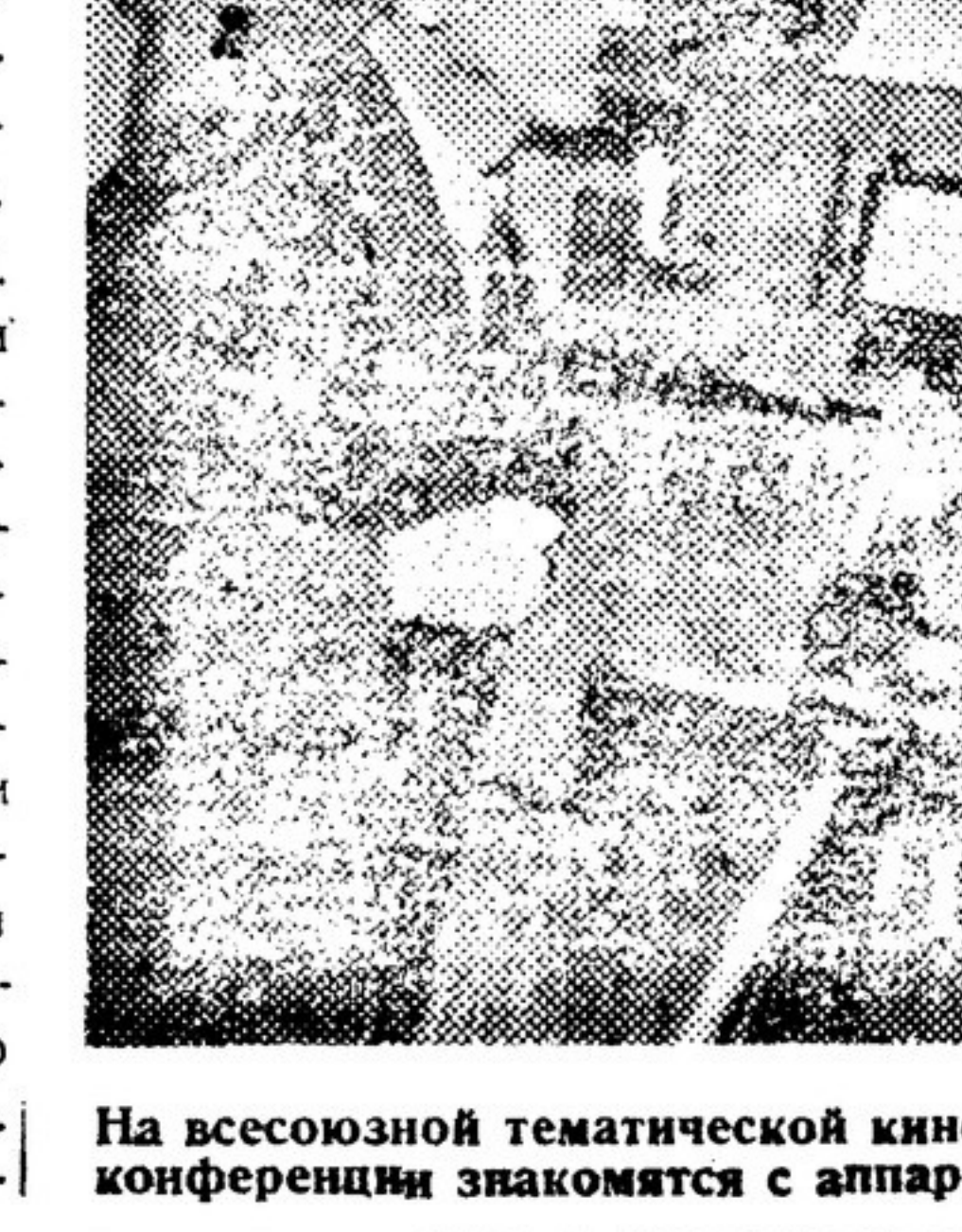
На всесоюзной тематической кино конференции знакомится с аппарата том для подводной киносемики.